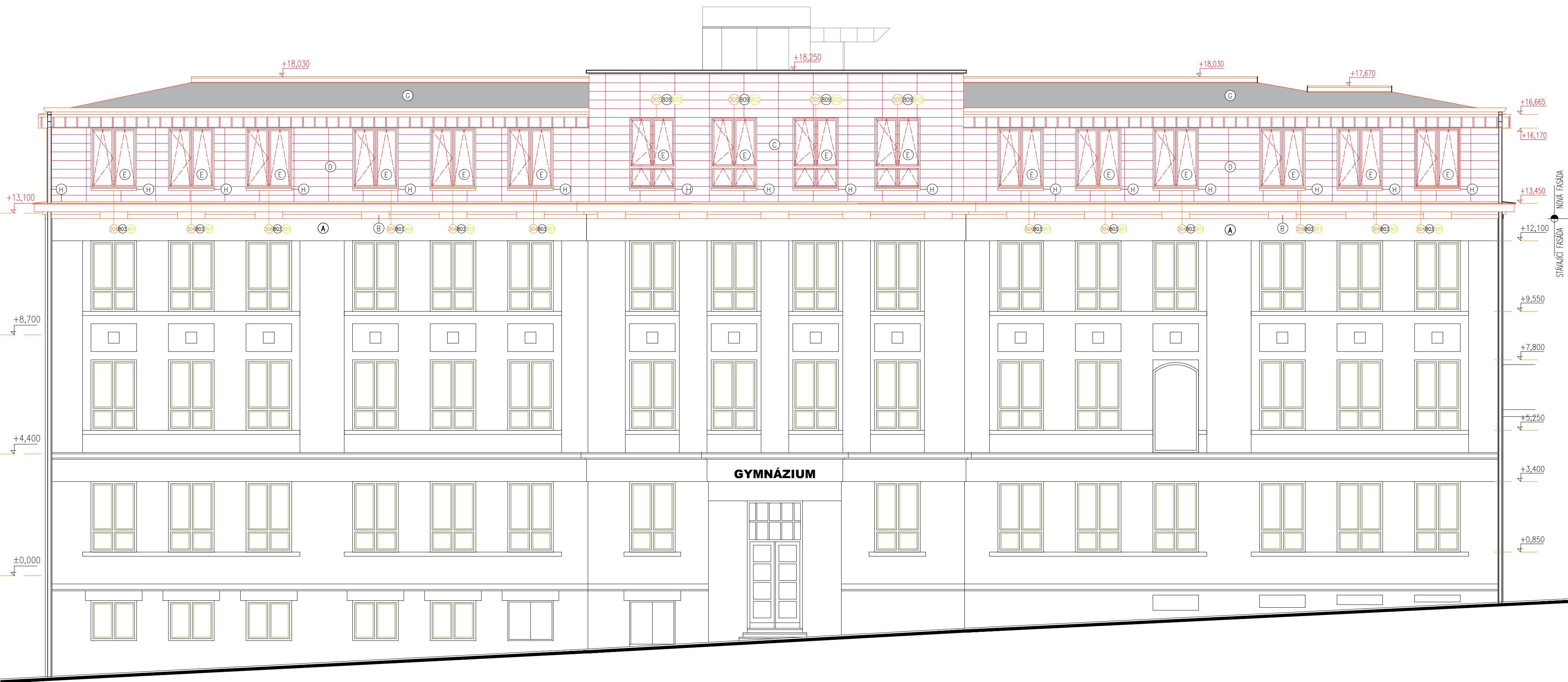
POHLED ULIČNÍ, M 1:100